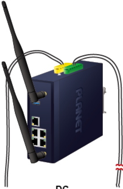
DC Power Failure