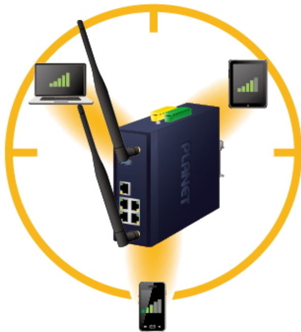
Dedicated and stable signals