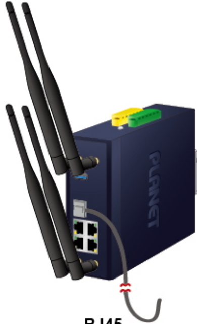
RJ45 Connection Link Down