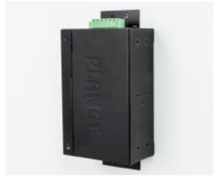
Side Wall Mounting (Space saving)