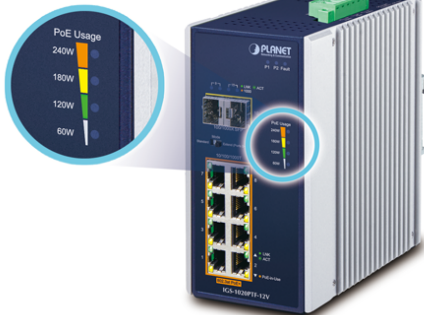
PoE Power Usage Display

ČSN EN 61000-4-11:2004 - Krátkodobé poklesy napětí, krátká přerušení a pomalé změny napětí