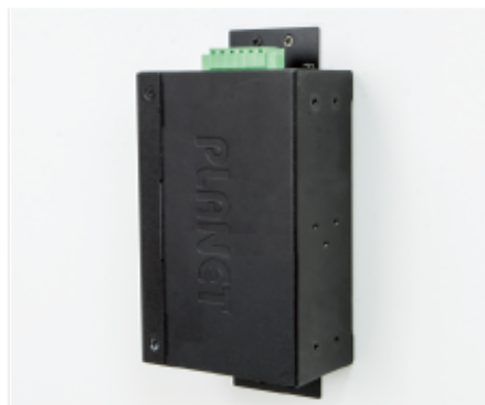
Side Wall Mounting (Space saving)